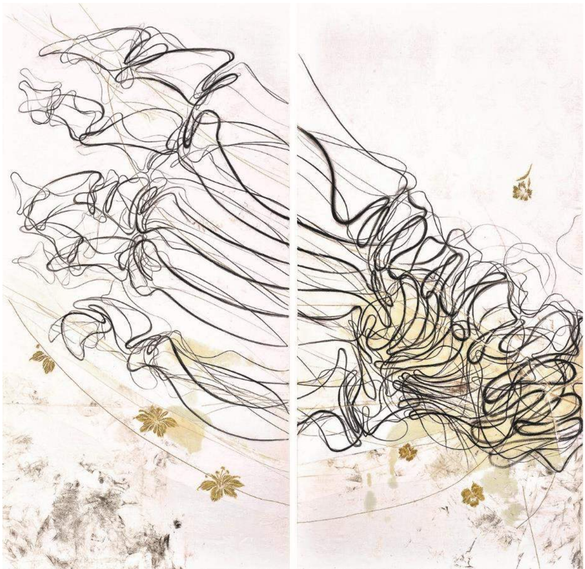
Ausschnitt aus dem MISEREOR-Hungertuch 2021/2022 „Du stellst meine Füße auf weiten Raum – Die Kraft des Wandels“ von Lilian Moreno Sánchez, © MISEREOR