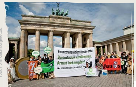
Politische Hilfestellung für die Regierung in Berlin: Aktivist/innen der Kampagne stärken Bundeskanzlerin Merkel im Juni 2011 zum nächsten EU-Ratstreffen den Rücken.

Ausführlichere Informationen unter http://www.steuer-gegen-armut.org/steuer-gegen-armut.html