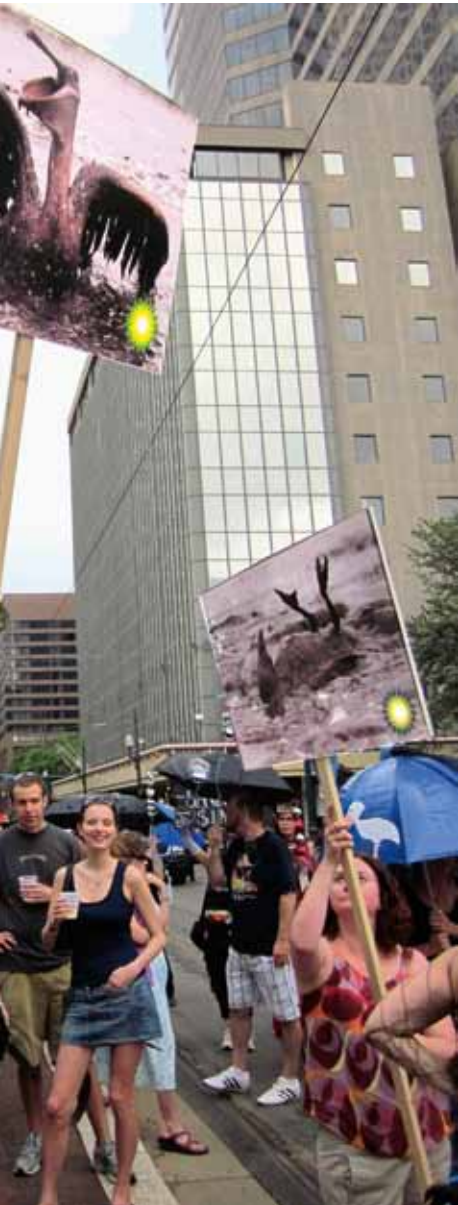
Eine Prozession im Geschäftsdistrikt von New Orleans erinnert mit Plakaten von Pelikanten an die Ölkatastrophe im Golf von Mexiko. Dort war im April 2010 die von BP geleaste Bohrrinsel „Deepwater Horizon“ explodiert.

Verantwortung wird dann nicht nur nach Rolle, kausaler Verursachung und Haftung, sondern vor allem auch nach Fähigkeiten zugeteilt. Auch wenn Nationalstaaten – auch aus Gründen der Legitimität – weiter die primäre Verantwortung für globale Kooperation und wirksame supranationale Institutionen zum Schutz von Gemeingütern haben, kann Unternehmen eine wesentliche Mitverantwortung zugeschrieben werden. Gerade weil sie Gemeingüter nutzen und das notwendige wirtschaftliche und politische Handlungsvermögen besitzen.