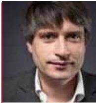
Sven Giegold Mitglied des Europaparlaments, Fraktion der Grünen

Wie sehen die Schritte zu einer sozial gerechten und ökologisch nachhaltigen Entwicklung aus? Welche Beiträge kann Deutschland, können Politik, Wirtschaft, Wissenschaft, Kirche und Zivilgesellschaft für die notwendige Orientierung an einem globalen Gemeinwohl leisten?