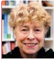
Prof. Dr. Gesine Schwan Präsidentin der Humboldt-Viadrina School of Governance

Doch Technologie ist wahrlich nicht alles. Letztlich werden wir die globalen Herausforderungen nur lösen, wenn wir lernen, global zu kooperieren und verbindliche Regeln zu vereinbaren. Bei aller berechtigten Kritik an der Verantwortung Europas für globale Armut und Naturzerstörung: Bei allen globalen Verhandlungen zu Umwelt, Menschenrechten, Waffenkontrolle oder Bürgerrechten haben die EU und ihre Mitgliedsländer regelmäßig die konstruktivsten Beiträge geliefert. Gerechte Globalisierung wird es nur mit einem geeinten Europa geben, das nicht auf den Trümmern eines ökonomisch und sozial gescheiterten Euro mit sich selbst beschäftigt ist und in Renationalisierung zurückfällt. Auch deshalb muss der einseitige Eurorettungskurs dringend korrigiert werden: sozial, investitionsorientiert und vor allem demokratisch muss er sein.