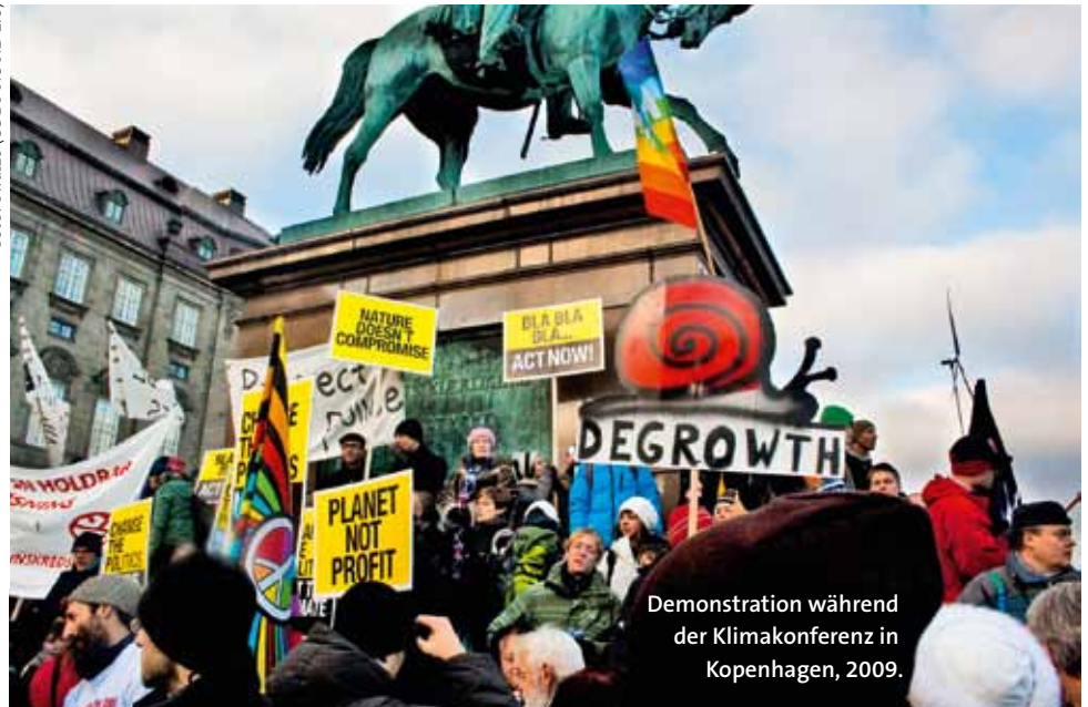
Demonstration während der Klimakonferenz in Kopenhagen, 2009.