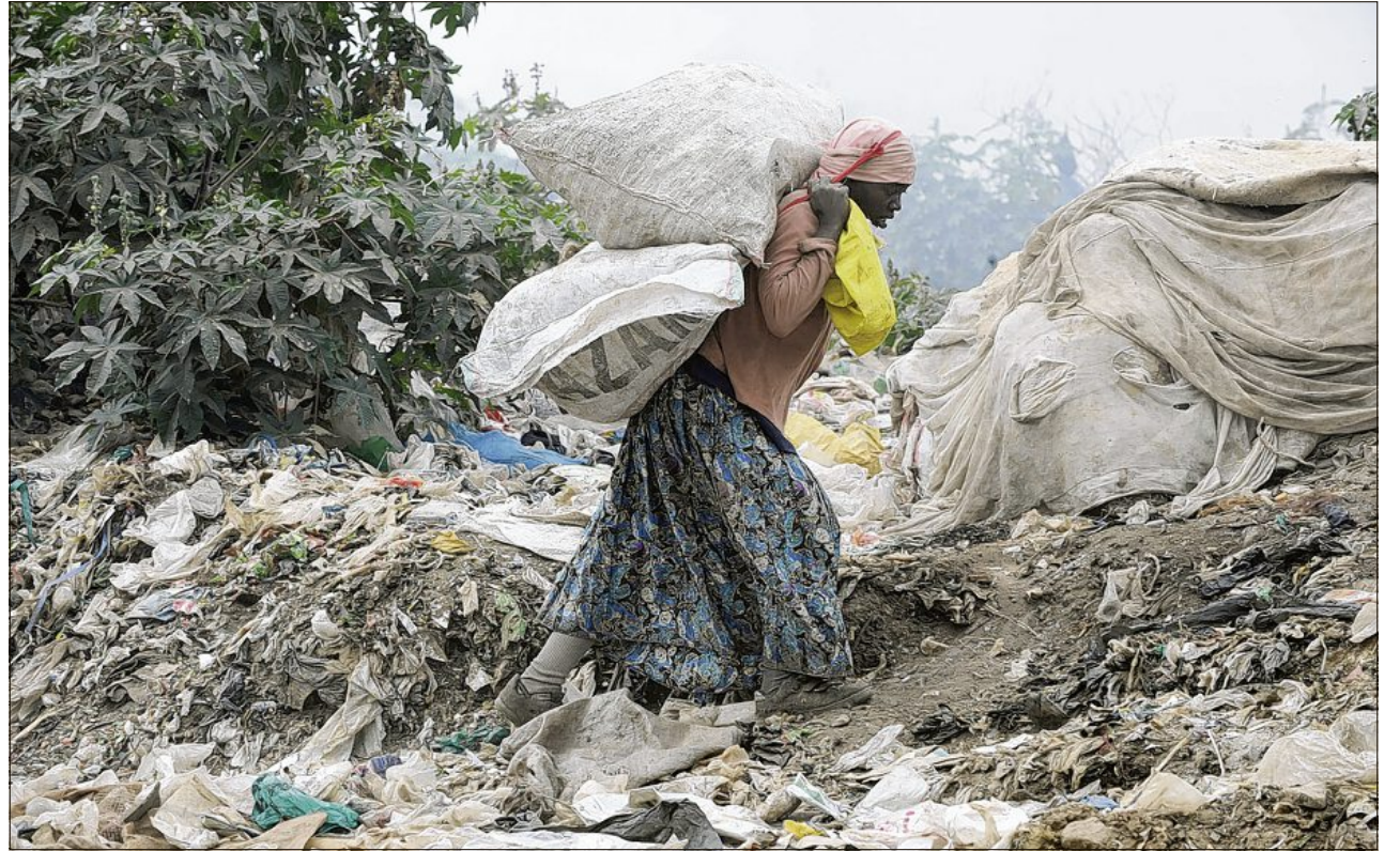
In kenianischen Slums gehört Müllsammeln zum Alltag.