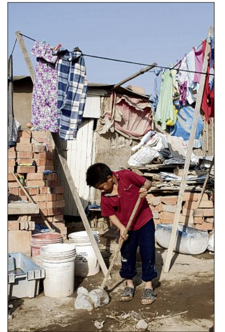
Menschenwürdig? Millionen Menschen weltweit leben in tiefster Armut – so wie dieser Bub in der peruanischen Hauptstadt Lima.

Misereor unterstützt Organisationen vor Ort, die den Bewohnern der Armenviertel helfen bei Wohnbau, der Anlage von gepflasterten Fußwegen oder der Installation von Zu- und Abwassersystemen sowie Toiletten. Ein weiteres zentrales Anliegen der Hilfsorganisationen ist es, dass die Menschen in ihren Vierteln bleiben dürfen oder entsprechenden Wohnersatz erhalten, falls sie doch umziehen müssen. Es gibt viel zu tun. Denn irgendwo auf der Welt wird tagtäglich das Menschenrecht auf Wohnen verletzt. –wes–