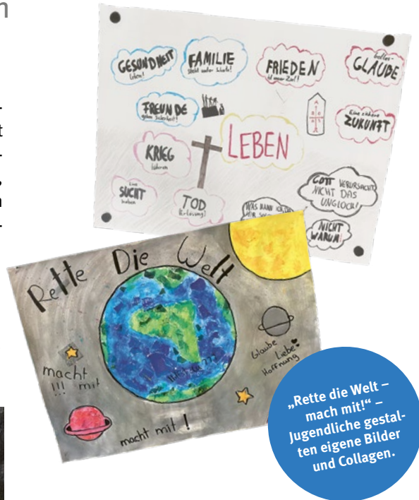
„Rette die Welt – mach mit!“ – Jugendliche gestalten eigene Bilder und Collagen.

So entstanden zum Beispiel in der Ludwig-Windthorst-Schule Hannover Collagen mit dem Appell, die großen Probleme wie Klimawandel, Armut und Unfrieden anzugehen. Im Pamina-Schulzentrum Herxheim arbeitete eine 10. Realschulklasse zum Thema „Glanz und Last des Lebens“. Die Schülerinnen und Schüler erstellten in Kleingruppen Plakate, die sie anschließend im Plenum präsentierten. Thematisch war der Bogen weit gespannt: von der Frage nach Gott und dem Leid zum Tod Jesu am Kreuz bis zum Sieg des Lebens, der in der Osternacht besungen wird.