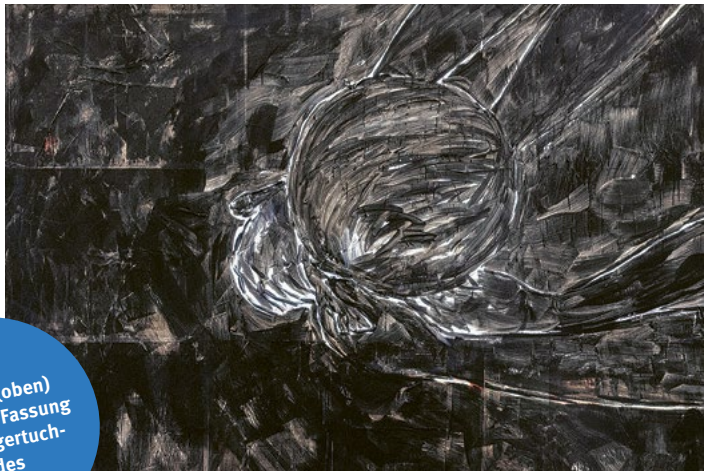
Vorstufe (oben) und finale Fassung des Hungertuch-Bildes

Petra Gaidetzka arbeitet als Referentin für schulische Bildung in der Misereor-Abteilung Bildung & Pastoralarbeit.