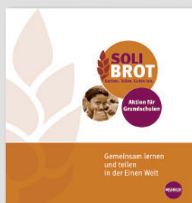
Der Ordner zur Solibrot-Aktion für Grundschulen

Wenn die Kinder wollen, können sie sich mit der Solibrot-Aktion für eines der vorgestellten Projekte engagieren. Mehr über die Solibrot-Aktion für Grundschulen, weitere Unterrichtsmaterialien und Bausteine für eine Projektwoche im Ordner sowie auf der Aktionsseite!