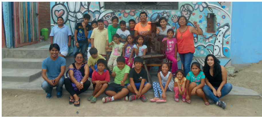
Kulturzentrum in Santa Rosa/Peru

Artikel 17 der Kinderrechtscharta betrifft den Zugang zu Medien, zu Informationen aus einer Vielfalt kultureller Quellen. Die Medien sollen Kinder fair informieren und weder ängstigen noch manipulieren. Kinder haben das Recht auf umfassende Bildung, die ihre Persönlichkeit und ihre geistigen sowie körperlichen Fähigkeiten zur Entfaltung bringen (Artikel 28 und 29). Kinder, die einer ethnischen, sozialen oder religiösen Minderheit angehören, haben das Recht auf ihre eigene Kultur (Artikel 30) und alle Kinder haben das Recht auf Beteiligung am kulturellen Leben (Artikel 31).