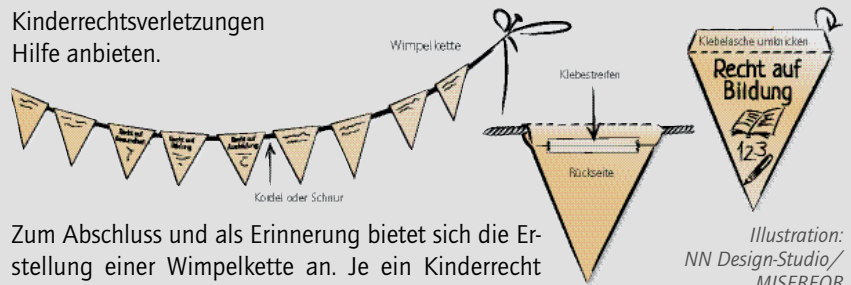
Illustration: NN Design-Studio/ MISEREOR

Stärkung der Kinderrechte beitragen können und welche Anlaufstellen bei Kinderrechtsverletzungen Hilfe anbieten.