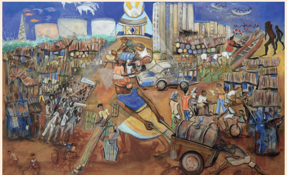
(Hungertuch 2011 „Was ihr dem Geringsten tut“ von Sokey Edoth)